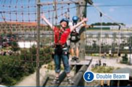
2 Double Beam