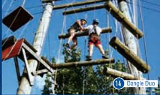
14 Dangle Duo