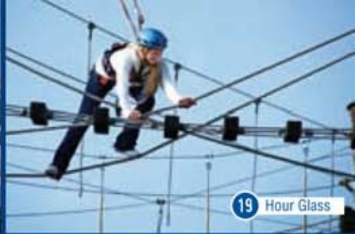
19 Hour Glass