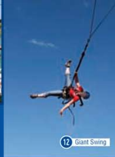
12 Giant Swing