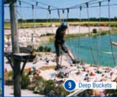
9 Deep Buckets